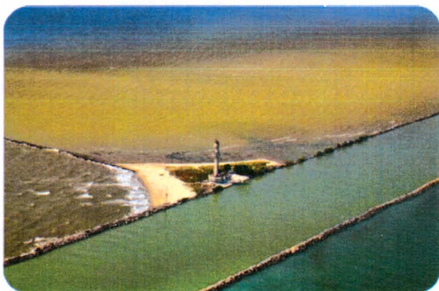
Cahul, Republica Moldova, 29 iunie 2018

ARTERĂ DE COMUNICAȚIE DIN PREISTORIE ÎN EPOCA MODERNĂ