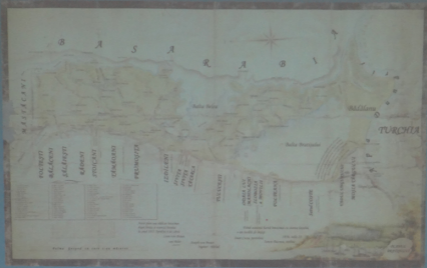
PLANUL BALTA BRATEȘULUI, 4 APRILIE 1835, REDACȚIE ROMÂNOCIRILICĂ, AUTORI JOSEF VON BELLER ȘI LEON VON BRAUN, SJIAN, COLECȚIA PLANURI, JUDEȚUL COVURLUI, PLANUL 3/1835 (SCARA 1/1)