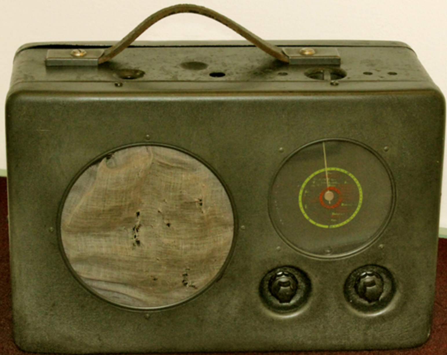
APARAT DE RADIO MILITAR