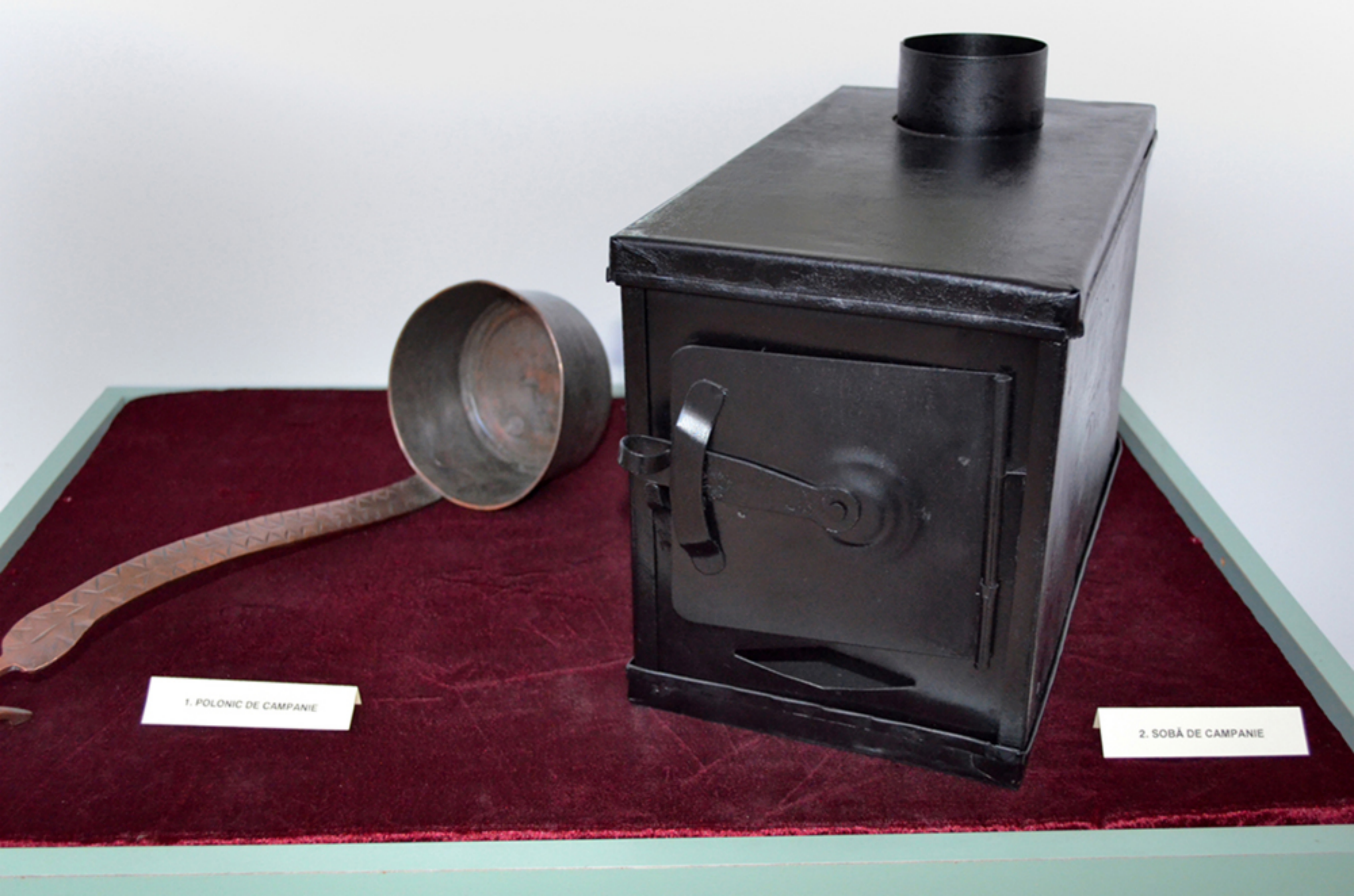
1. POLONIC DE CAMPANIE