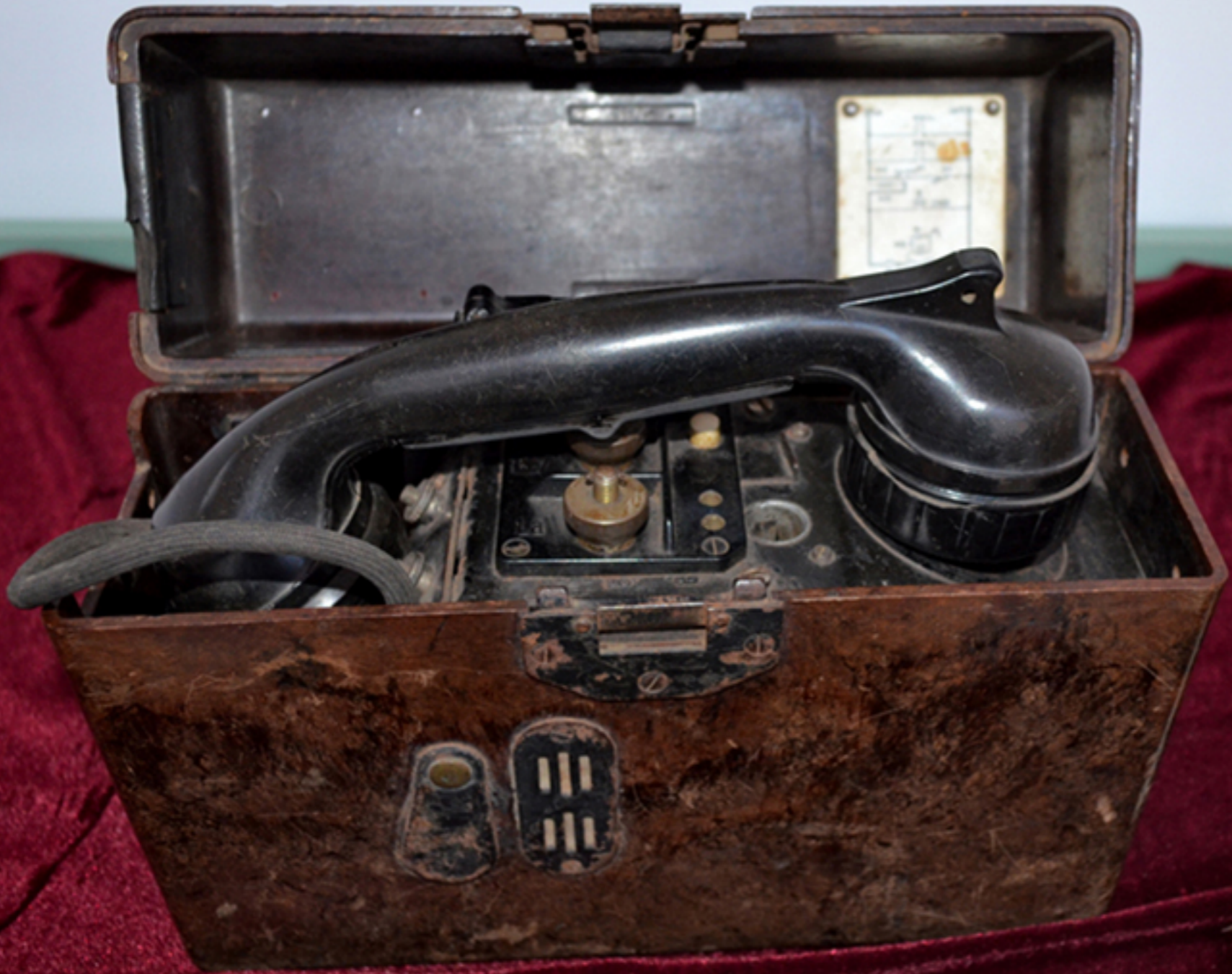
TELEFON DE CAMPANIE, 1941