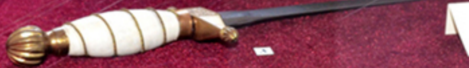
1. Binoclu militar cu etui din piele 2. Caschetă ofițer marină 3. Săiet marină