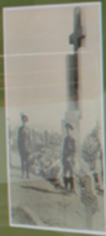
A tall monument or structure in an open area.