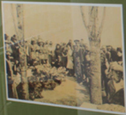
A large group of people gathered outdoors.