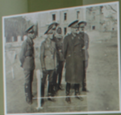
Three men in military uniforms standing outdoors.