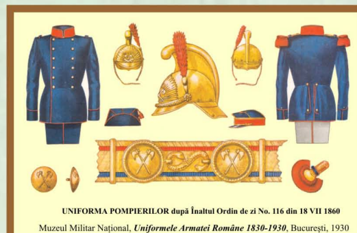
UNIFORMA POMPIERILOR după Înaltul Ordin de zi No. 116 din 18 VII 1860 Muzeul Militar Național, Uniformele Armatei Române 1830-1930, București, 1930