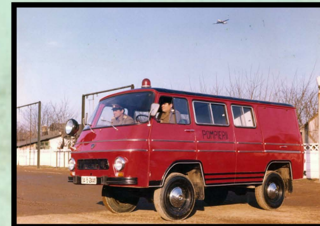
Autopompă cisternă de intervenție TV