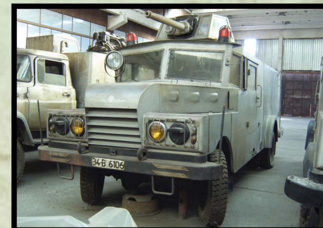
1975. Autospecială de lucru cu spumă