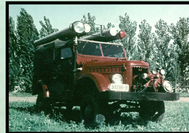
1957-1959. Autopompă rapidă de intervenții la incendii IMS 57

surse: Inspectoratul General pentru Situații de Urgență; Muzeul Pompierilor „Foișorul de Foc” București.