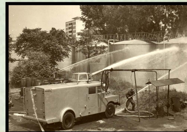
1973. Autospecială de intervenție la foc