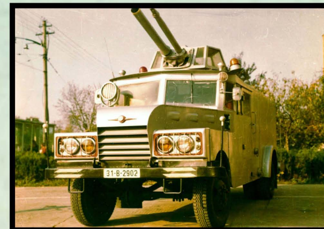
1958. Autotun de stins incendii ATI SR 114