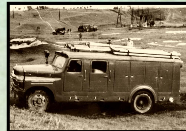
1962. Autopompă cisternă SR 104 (UMT)