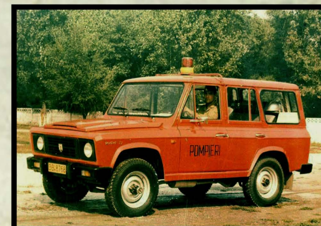
1987. Autospecială prima intervenție și comandă APIC ARO 244