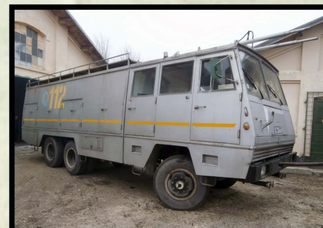
1980. Autopompă cisternă Roman 1221