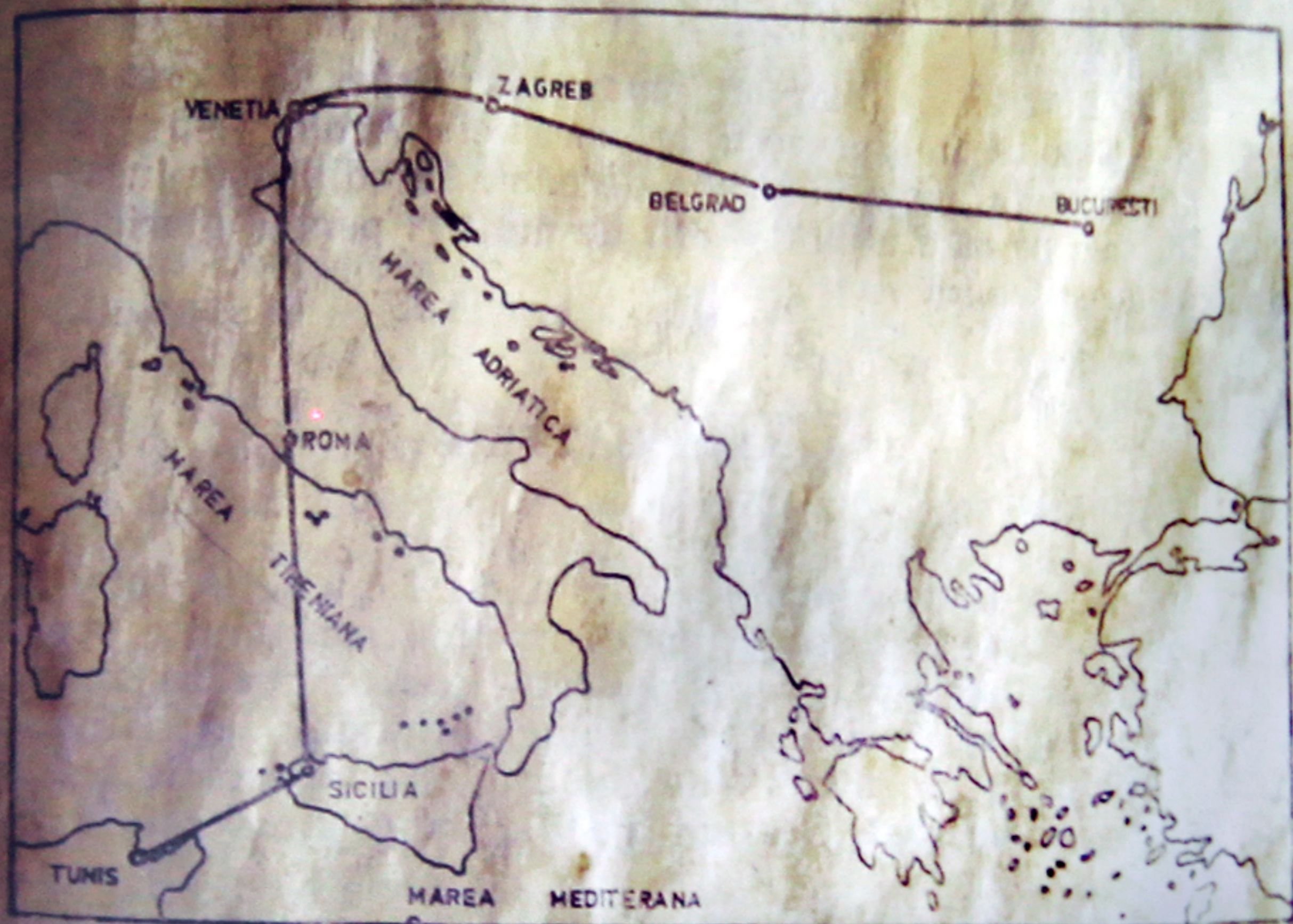
Fig. 29 Raidul Smarandei Brăescu.