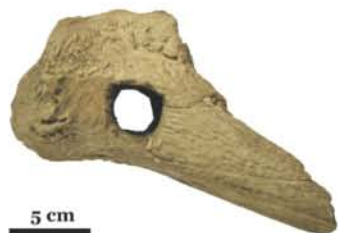
Vârf de corn

Proiectul cultural, cu logo-ul “DanubiOs”, este finanțat de către Administrația Fondului Cultural Național și se încadrează în aria tematică “Patrimoniu cultural național”. Perioada de derulare a proiectului este 15 august - 15 noiembrie 2012.